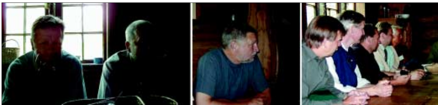
På studiebesök i Maihaugen blev alla involverade, åtminstone muntligen, i sysslorna på en gård för 100 år sedan.