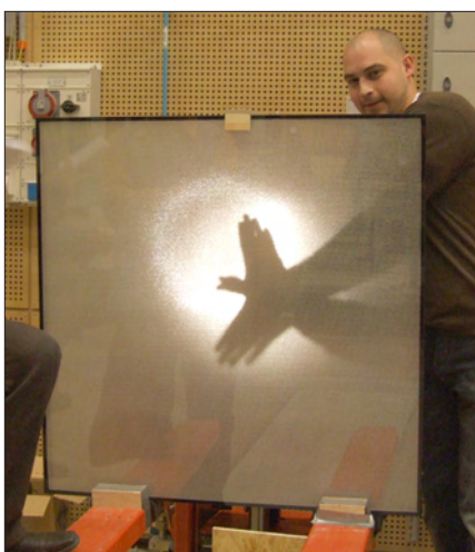
Fönster från Okalux fyllt med plaströr som läpper igenom ett visst ljus.