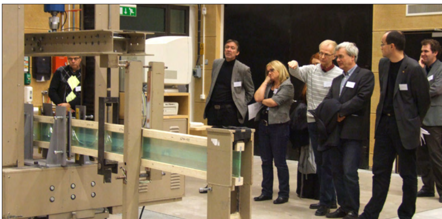
Den fyra meter långa balken av glas och trä satt fast i ändarna och drogs med kontrollerad kraft upp på mitten tills den bröts av.