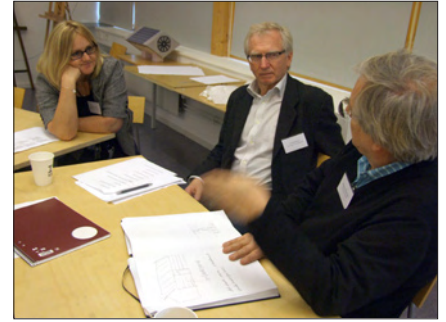
Delar av de olika diskussionsgrupperna: konstruktion, estetik och affärsmodell.

b) Vilka nya typer av element kan du tänka dig att materialkombinationen glas och trä möjliggör?