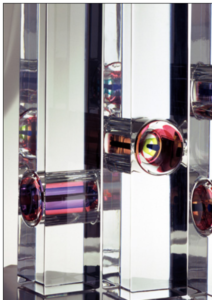
Skulptur, design Erika Lagerbielke, foto Rolf Lind.