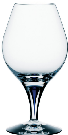
Intermezzo Avec, design Erika Lagerbielke.

Att få in den blå färgen i droppen krävde stor yrkesskicklighet och utvecklingstiden blev så lång att hela projektet stoppades. Projektet räddades dock av en mycket envis och mycket skicklig glasblåsare som gav sig den på att lösa det tekniska problemet. Erika säger: "All min kärlek till glasets hantverk är innesluten i den blå Intermezzodroppen". Samarbetet med de skickliga hantverkarna med vars händer hon skapar är helt avgörande vid utvecklingen av ett nytt glas.